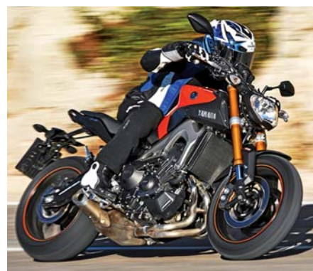
Sparmobil: Wie günstig und gut lässt sich Yamahas MT-09 versichern?

trägen ihr Geld verdienen. Der MOTORRAD-Tarifvergleich will Ihnen dagegen nichts aufschwätzen, sondern eine transparente Vergleichsmöglichkeit bieten. Deshalb arbeiten wir seit Jahren mit der unabhängigen Ratingagentur Franke und Bornberg ( www.franke-bornberg.de ) zusammen. Die Hannoveraner Versicherungsanalysten bewerten Tarife und Leistungen dabei auf Basis verbindlicher Quellen, die in den Vertragsbedingungen genannt werden müssen. Als Musterfall diene uns in diesem Jahr eine Yamaha MT-09 mit folgenden Eckdaten: EZ 5/2014, 847 cm 3 , 85 kW/115 PS, ABS, Neupreis (2014): 7995 Euro, Zeitwert (2016): 5500 Euro. Der Versicherungsnehmer ist männlich, 32 Jahre alt, hat den Führerschein seit 2002, ist alleiniger Nutzer und in die SF-Klasse 14 eingeteilt. Zulassungsbezirk ist HH (PLZ 21107), die jährliche Fahrleistung beträgt 4500 km, eine Garage ist nicht vorhanden. Versicherer, die in unserem Ranking mit fünf Sternen bewertet werden und bei denen maximal 50 Prozent vom Mittelwert aller Prämien im Vergleich gezahlt werden müssen, werden mit dem MOTORRAD Top-Tarif ausgezeichnet.