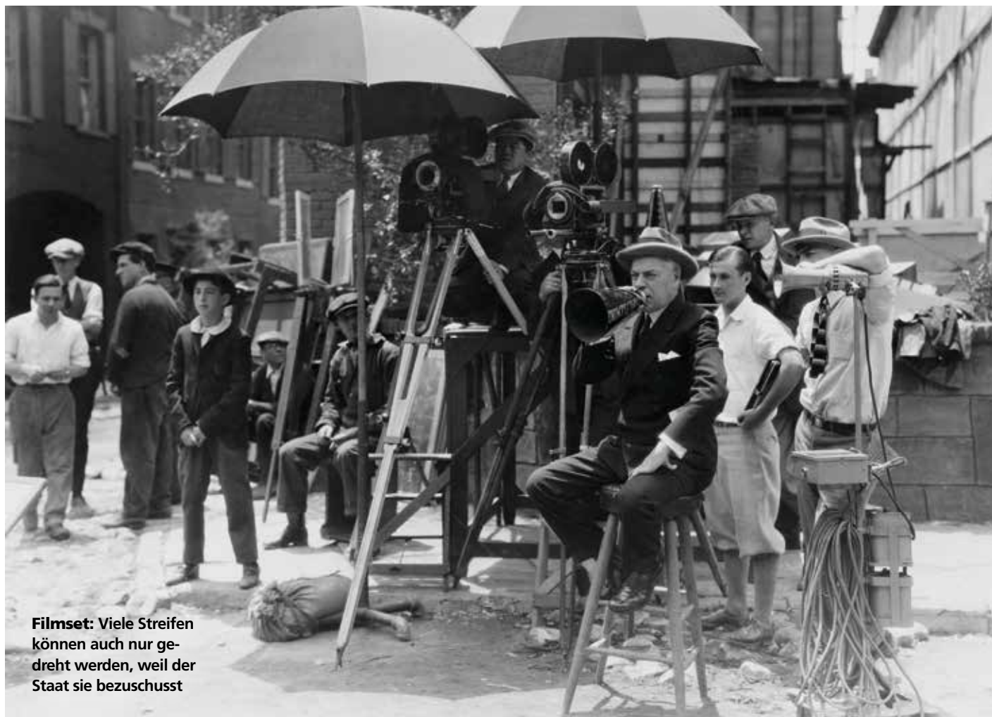
Filmset: Viele Streifen können auch nur gedreht werden, weil der Staat sie bezuschusst