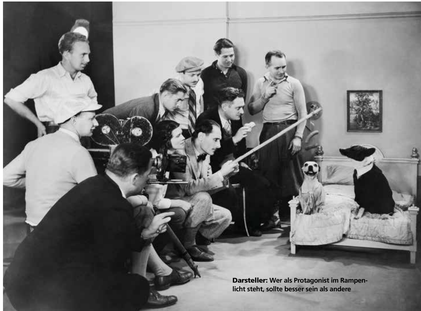
Darsteller: Wer als Protagonist im Rampenlicht steht, sollte besser sein als andere