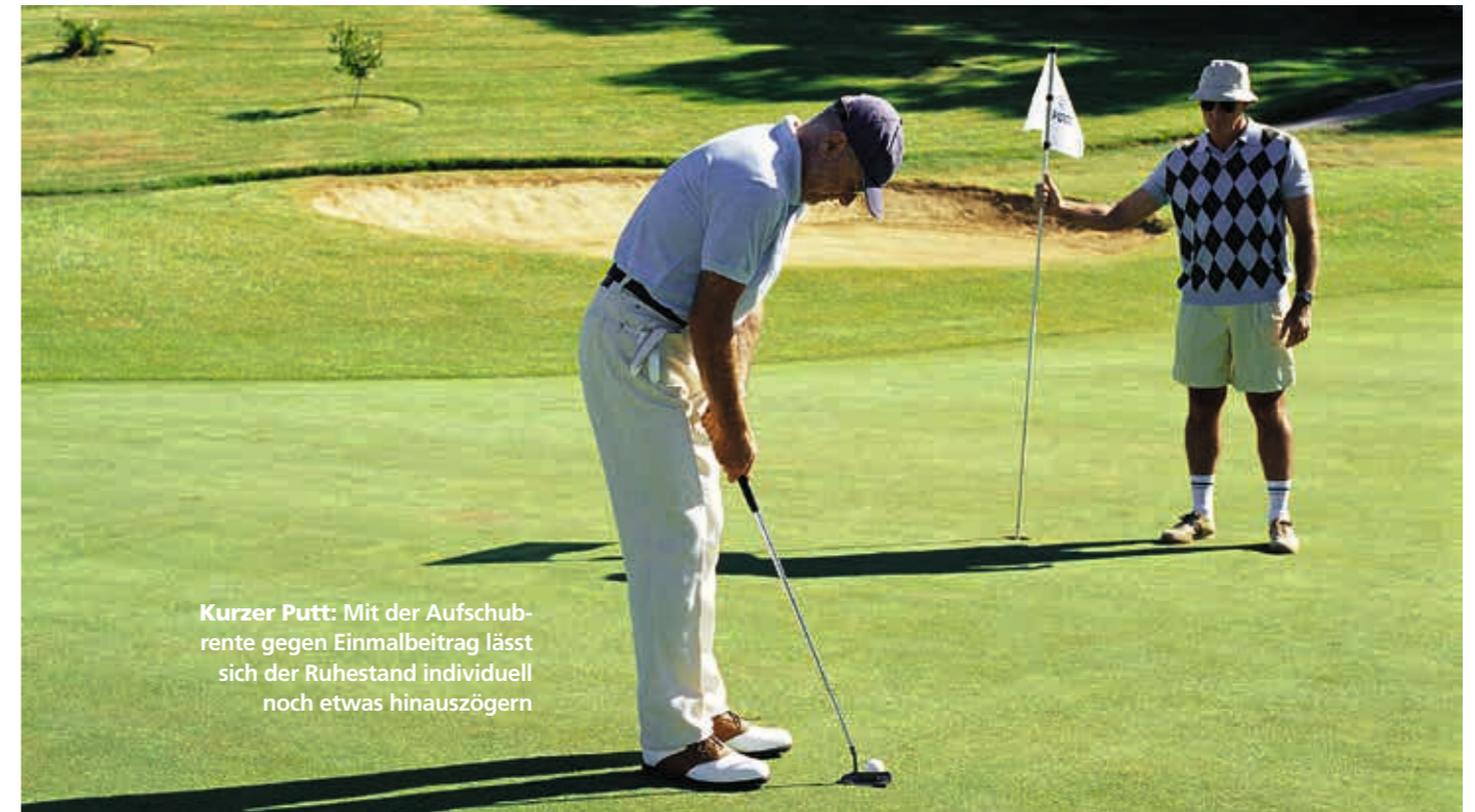
Kurzer Putt: Mit der Aufschiebrente gegen Einmalbeitrag lässt sich der Ruhestand individuell noch etwas hinauszögern