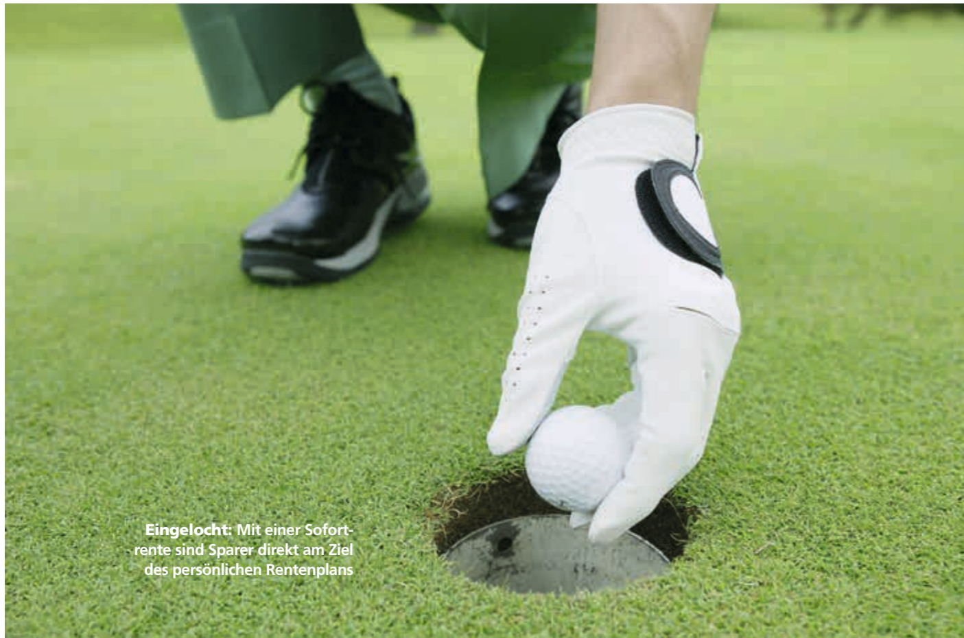
Eingelocht: Mit einer Sofortrente sind Sparer direkt am Ziel des persönlichen Rentenplans