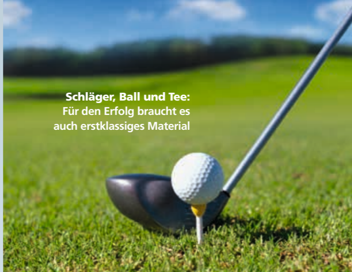
Schläger, Ball und Tee: Für den Erfolg braucht es auch erstklassiges Material

Auch die besten Aufschubrenten gegen Einmalbeitrag, die FOCUS-MONEY ebenfalls gemeinsam mit Franke und Bornberg untersucht hat, müssen wieder in drei Kategorien überzeugen: Für die Finanzstärke der Gesellschaften gilt dasselbe wie bereits bei den Sofortrenten auf Seite 3.